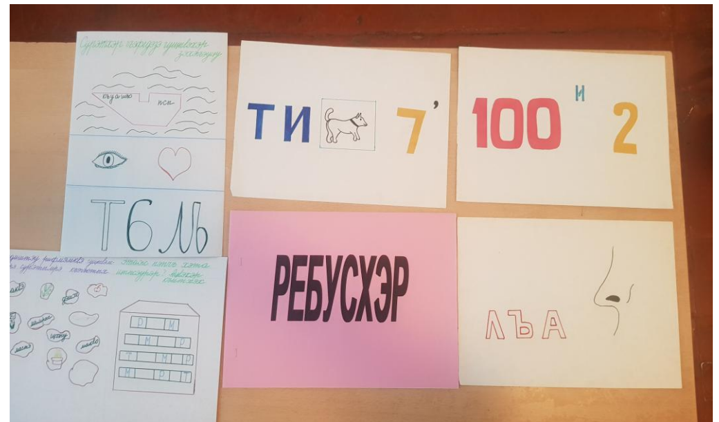
Зам.директора по УВР